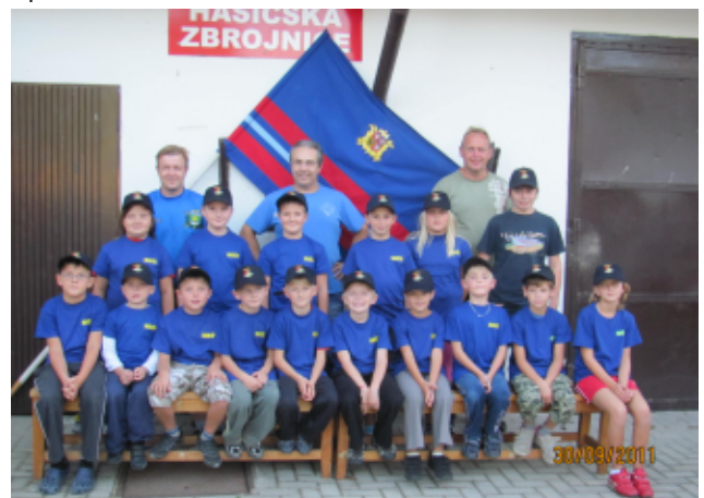
Za SDH Vědomice V. Sazeček

Podrobnosti naleznete na našich webových stránkách http://sdhvedomice.unas.cz